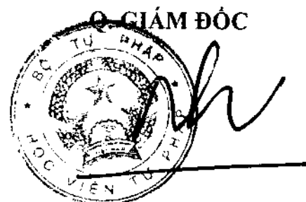
Đoàn Trung Kiên